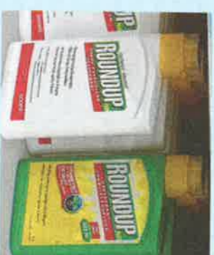
Uit het recente Monsanto-schandaal bleek dat de producent op zijn minst in één van de gebruikte wetenschappelijke studies de resultaten heeft bijgestuurd.